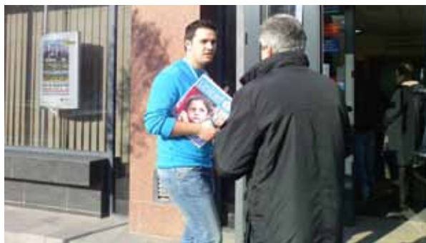
Primul program de strângere de fonduri Face to Face (față în față cu donatorul) lansat în România