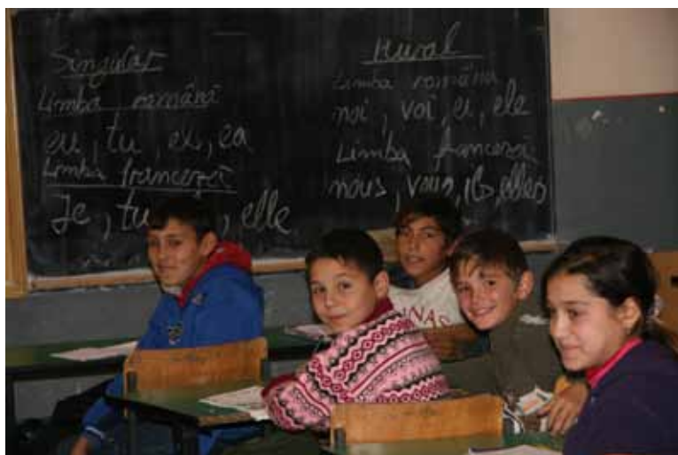
Școlile incluse în campanie s-au angajat să fie mai prietenoase pentru copii.