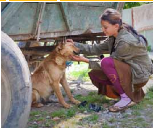
Campania pentru participarea școlară „Hai la școală!“ are ca obiectiv reducerea absenteismului și abandonului școlar.

La mijlocul anului 2010, UNICEF a lansat, în parteneriat cu Ministerul Educației, Cercetării, Tineretului și Sportului și cu Institutul de Științe ale Educației, campania „Viitorul copiilor