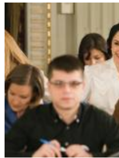
Ambasador al Bunăvoinței pentru copii stând de vorbă cu un donator

Deși cele două țări se află la peste zece mii de kilometri depărtare, românii și-au deschis inima și au donat pentru oamenii afectați de cutremur din Haiti, în cadrul unui teledon organizat de UNICEF și postul Realitatea TV. Evenimentul, susținut de personalități din viața politică, show-business, din lumea afacerilor și cea a sportului, a reușit să strângă peste 750.000 de dolari, pe care UNICEF îi va folosi pentru a asigura hrană, adăpost și protecție copiilor din Haiti după devastatorul cutremur din ianuarie. Donațiile românilor vor susține eforturile depuse de UNICEF pentru a găsi copiii dispăruți, pentru a le oferi un adăpost sigur și a-i readuce aproape de familia lor, dar și pentru a asigura apă potabilă unui număr de aproximativ un milion de persoane și pentru a imuniza jumătate de milion de copii împotriva unor boli transmisibile.