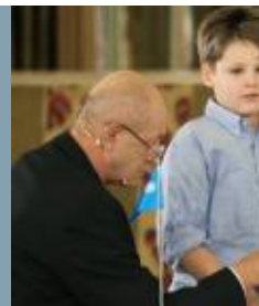
Realitatea TV, intervievând donatori și pe mama a

Personalitățile publice și companiile au fost printre primele care au donat, după ce gazda Mihai Tatulici a dat tonul cu propria sa donație. Președintele Traian Băsescu și