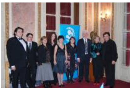
UNICEF România/ Mulțumiri speciale organizatorilor și participanților la concertul de la Muzeul Național George Enescu