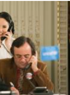
Andreea Marin Bănică, reprezentant UNICEF România,