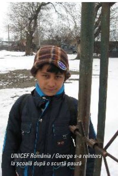
George s-a reîntors la școală după o scurtă pauză

„Discutăm cu părinții... mergem acasă, discutăm cu părinții... Intervin și organele locale dacă noi cadrele nu avem posibilitatea să îi lămurim... Să știți că ei chiar s-au implicat...ii mai speriem cu o amendă...” (județul Dâmbovița, interviu cadru didactic).