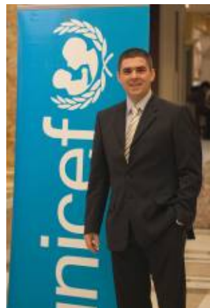
UNICEF România/Silviu Covaci/ Vlad Enachescu, Realitatea TV, s-a alăturat eforturilor UNICEF pentru copiii din Haiti