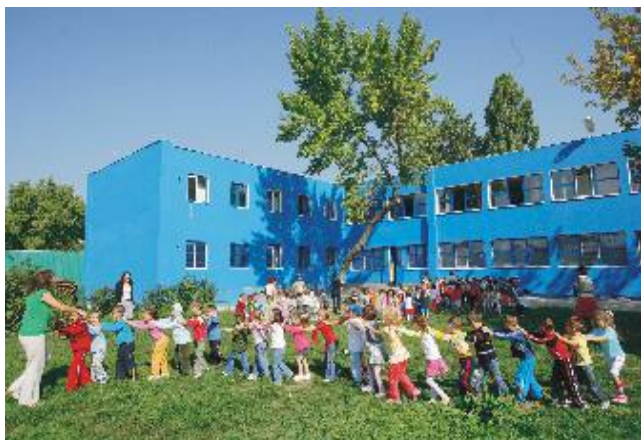
Căminul Phillip: o rază de lumină într-un peisaj sumbru

„E atât de generos, că le repară calculatoarele prietenilor pe gratis, ba și chiar și prietenilor prietenilor. Întotdeauna îi pune pe alții înaintea lui”, dă mama din cap a neîncredere și aprobare în același timp, mulțumită că a crescut un bărbat bun.