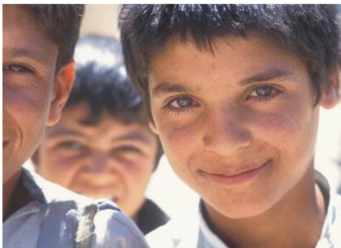
Depind de măsurile luate de administrație

Agențiile guvernamentale, ONG-urile și Biserica au format comitete mixte pentru a orienta serviciile sociale către servicii de prevenire sperând să își îmbunătățească calitatea și să ofere o valoare mai mare în schimbul costului. În timp ce intenția este generoasă și pertinentă, până la a găsi soluțiile adecvate timpul și banii se termină pentru cei care depind de sprijinul lor.