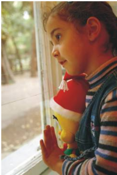
Mica prințesă visează la zile mai bune.