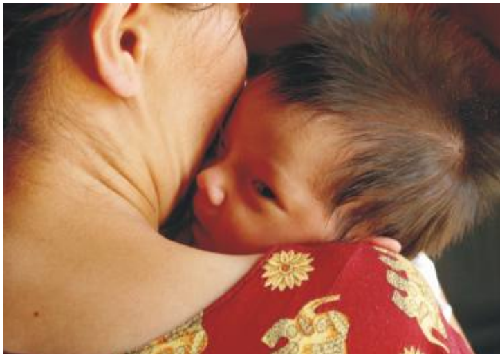
Această tânără mamă ar fi fost pierdută fără vizitele la domiciliu ale doctoriței

O altă măsură de austeritate a fost să se reducă cheltuielile lunare ale medicilor de familie. Dacă, în funcție de volumul de muncă, medicul și-a utilizat banii alocați pe lună înainte să se termine luna, trebuie să își taxeze pacienții care vin la consultații după aceea. Lăsând la o parte justiția socială, o consecință probabilă a acestei situații va fi o presiune și mai mare asupra serviciilor de urgență,