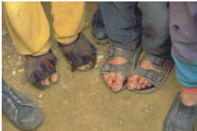
În ce măsură au fost afectați de criza financiară săracii cronici din România?

potrivit statisticilor din 2009, numărul de copii care trăiau sub limita sărăciei, crescuse cu 100.000 în comparație cu datele dintr-un studiu anterior. Dintre aceștia, sute necesită asistență socială specializată dar doar un procent mic, și mai exact cazurile cele mai grave de abuz de minori sunt soluționate și asta din cauza incapacității sistemului de a se ocupa de cererea în creștere. Despre cei cu situații considerate mai puțin grave nu se mai știe nimic. Sunt sufletele pierdute ale României. Neclar? V-am avertizat.