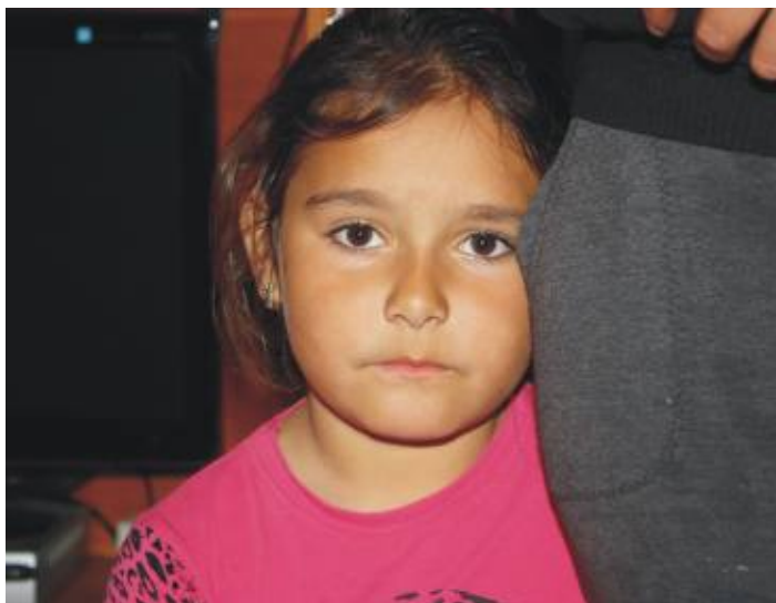
Nu prea ai motive să zâmbești în această perioadă

„Mami, iar avem fasole diseară?” întrebă băieții încrunțându-se, ținându-se cu mâinile de burțile umflate.