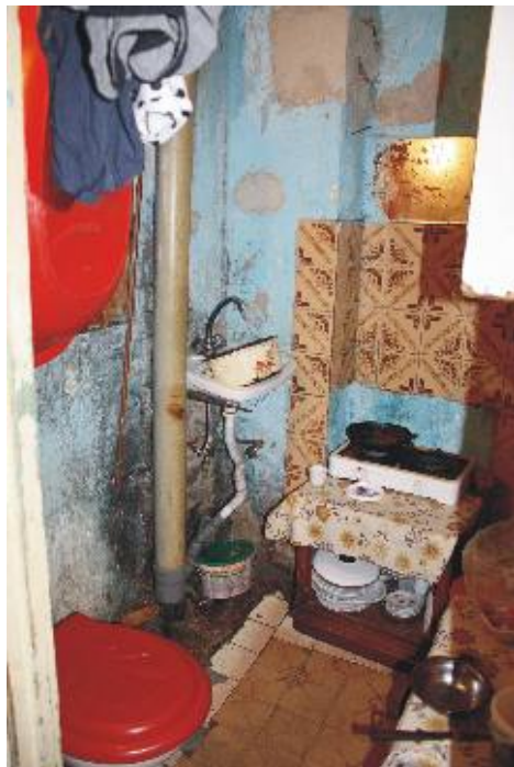
Două într-una: bucătărie și baie

„Cel puțin nu e hoț,” spune mama. „Anul trecut, trei adolescenți din bloc au fost duși la închisoare pentru furt.”