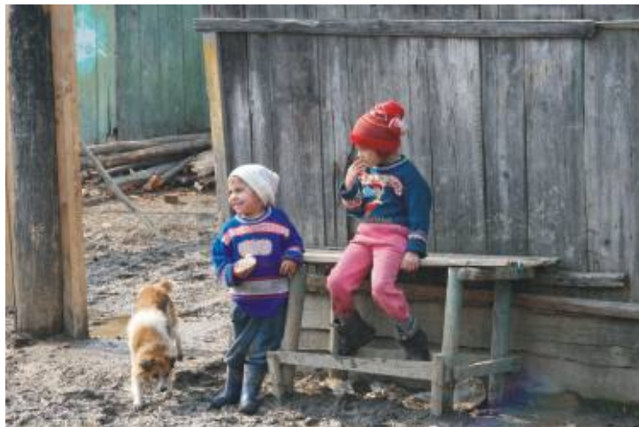
România rurală este un ecou dintr-o epocă demult apusă

minute de mers cu mașina de Otopeni se află Băneasa, aeroportul folosit de liniile aeriene low-cost. Nu are o sală adecvată pentru sosiri. Prietenii și familia trebuie să stea la coadă în aer liber ca să le ureze bun-venit celor dragi și sunt la mila vremii. Zona de control pașapoarte a cunoscut și zile mai bune. Vopseaua crăpată, gresia spartă și